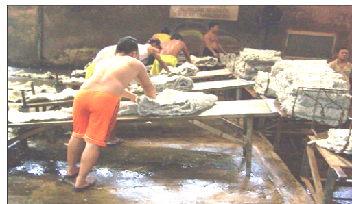
Gambar 2: Kondisi Bekerja di SKBB Lama (PO)/ Sebelum Perancangan berbasis Ergonomi Total

Kondisi tugas ( task ) yang dilakukan oleh para pekerja di SKBB pada P0, seperti terlihat pada Gambar 2.