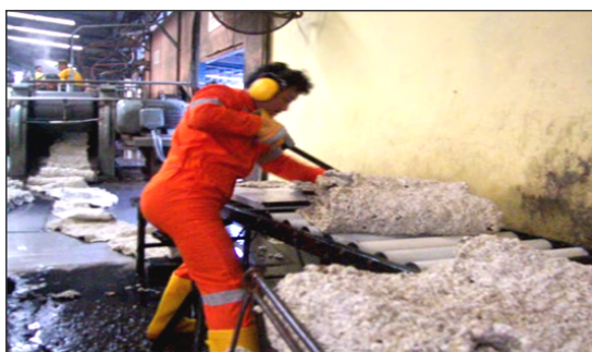
Gambar 3: Kondisi Kerja di SKBB Baru (P1)/ Setelah Perancangan berbasis Ergonomi Total

dan pisau pemotong blanket basah yang digerakkan secara manual didasarkan pada waktu siklus proses produksi per keping yang lebih pendek, proses pemotongan lebih cepat dan rapi. Manfaat lain yang menjadi dasar pertimbangan untuk melakukan perubahan dan modifikasi adalah keluhan muskuloskeletal yang menurun. Desain kursi K2B2-D didasarkan atas pertimbangan masukan dari para pekerja dan mandor yang berhasil ditabulasi dalam lokakarya dan juga pertimbangan keluhan muskuloskeletal, karena selama ini pekerja melakukan aktivitas bekerja melipat blanket basah dengan berdiri sepanjang waktu shift kerja. Proses kerja di SKBB termasuk jenis pekerjaan dinamik repetitif dengan sikap kerja berdiri atau duduk-berdiri. Oleh sebab itu akan lebih alamiah/ fisiologis jika didisainkan standing-seat chair (K2B2-D) yang relevan dengan antropometri pekerja dan dapat diatur ketinggiannya. Rancangan K2B2-D didesain dengan menggunakan kaki kursi tripot, landasan kursi saddle sepeda, terdapat adjustable height dibawah kursi saddle dan kursi dapat dilipat sehingga mudah dipindahkan dan pekerja dapat dengan bebas memilih duduk atau duduk-berdiri memakai K2B2-D. Desain K2B2-R yang sesuai antropometri pekerja dapat mengurangi keluhan muskuloskeletal. Kondisi Kerja di SKBB Baru (P1)/ Setelah Perancangan disajikan pada Gambar 3.